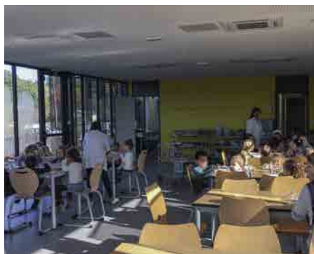
Le restaurant scolaire