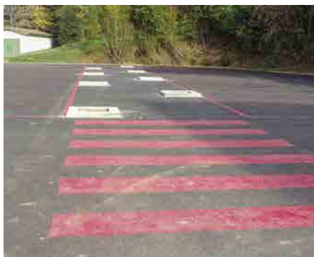
Le parking de l'école

Lumineux, fonctionnel, plus grand et disposant d'une jolie vue sur les alentours, le nouveau restaurant scolaire a accueilli ses premiers convives dès le jour de la rentrée ! Tout comme la classe de maternelle et son dortoir construit dans les locaux de l'ancienne cantine.