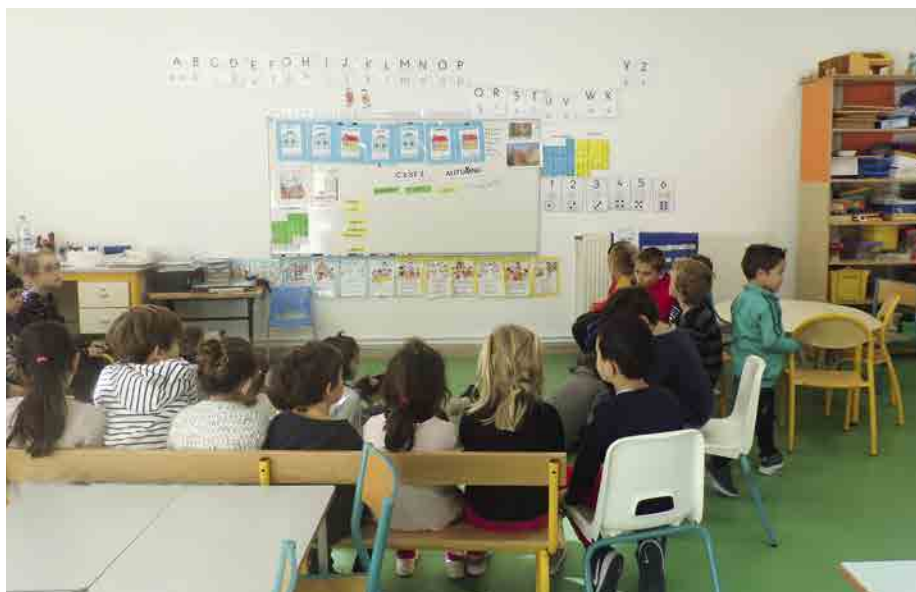
La nouvelle classe

Après un été de travaux importants, l'école inaugurerait à la rentrée un nouveau parking, un nouveau restaurant scolaire et une nouvelle classe en maternelle ! Objectif : les meilleures conditions de travail et de vie pour les enfants et les adultes qui les encadrent.