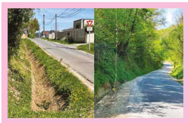
Entretien des fossés et élagage dans le secteur Baragne et la rue du Grand Port.

Par ailleurs, les élus cambais ont fait un bilan complet de l'état des routes gérées par la commune. « Notre objectif est de réhabiliter la voirie municipale, là où c'est nécessaire et dans la mesure de nos moyens, dans le cadre d'un plan pluri-annuel qui sera lissé sur les cinq prochaines années » annonce l' élu municipal.